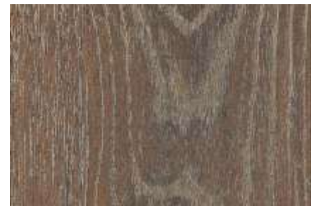
SPC 403 CARVALHO CASTANHO