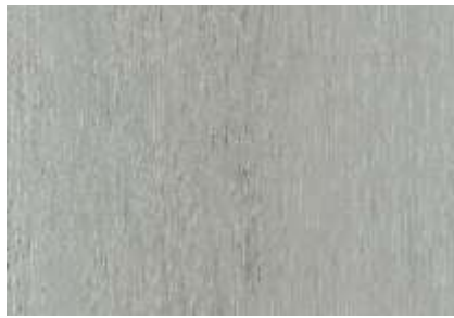
SPC 406 CARVALHO CINZA-CLARO