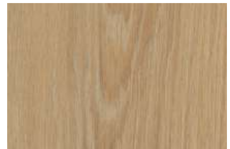
SPC 410 CARVALHO CLARO