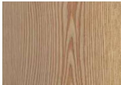
SPC 409 RIGA