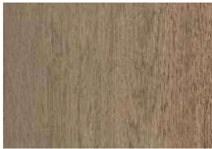
SPC 402 CARVALHO INGLÊS