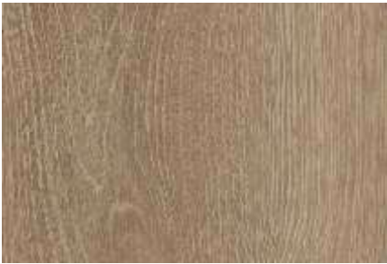
SPC 404 CARVALHO TERRA