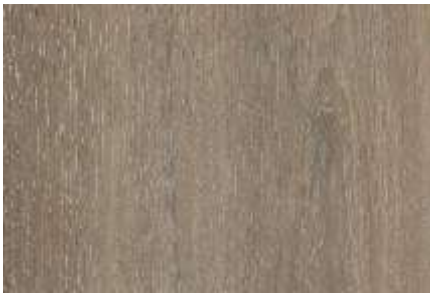
SPC 401 CARVALHO BEGE