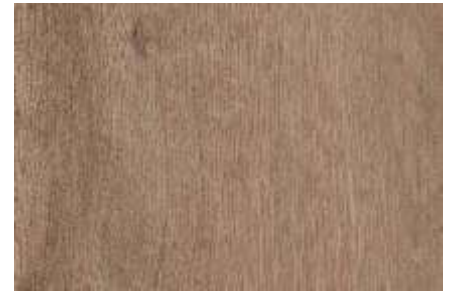
SPC 407 CARVALHO NATURAL