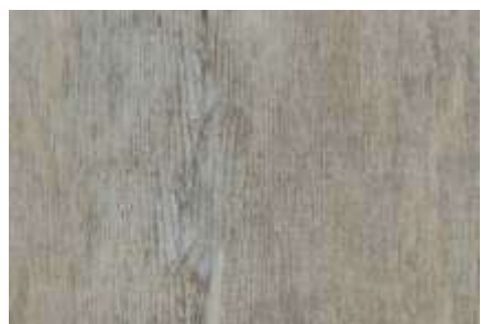
SPC 107 CARVALHO RANCH