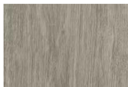
SPC 103 CARVALHO CINZA