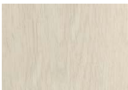
SPC 102 CARVALHO DOVE