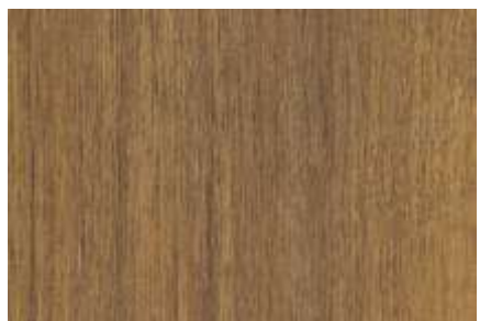
SPC 127 NOGUEIRA