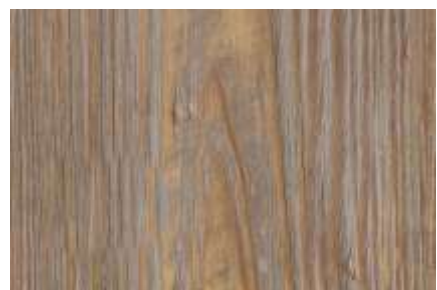
SPC 112 PINHO CINZA