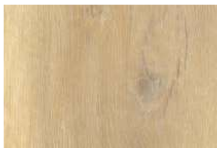
SPC 117 CARVALHO BOHEMIA