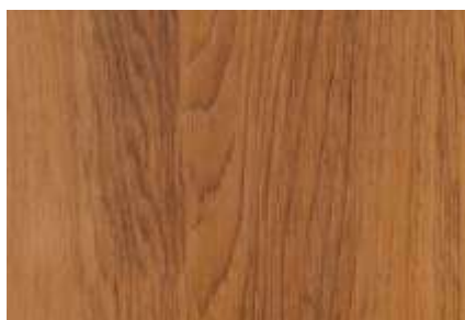
SPC 136 AFIZÉLIA