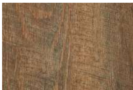
SPC 101 CARVALHO OREGON