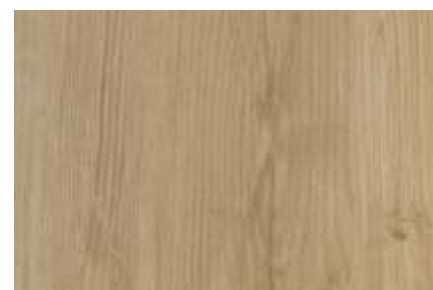
SPC 119 CARVALHO CLARO